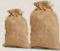
جراب 50 كجم (تمر مجفف)