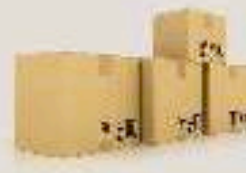
صندوق 25 كجم (تمر)