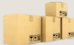
Картонные коробки по 25 кг (даты)