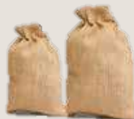
Пакеты по 50 кг (сухие финики)